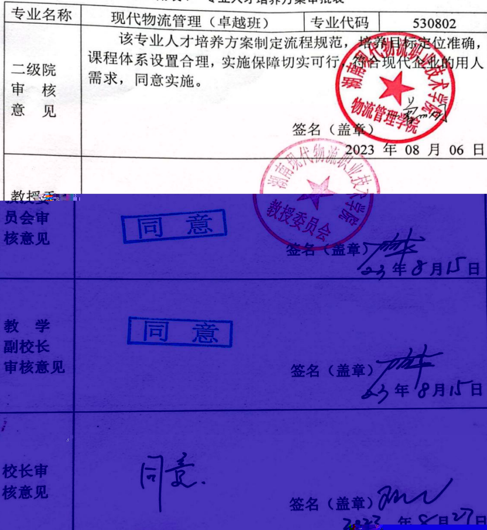
附表7 专业人才培养方案审批表